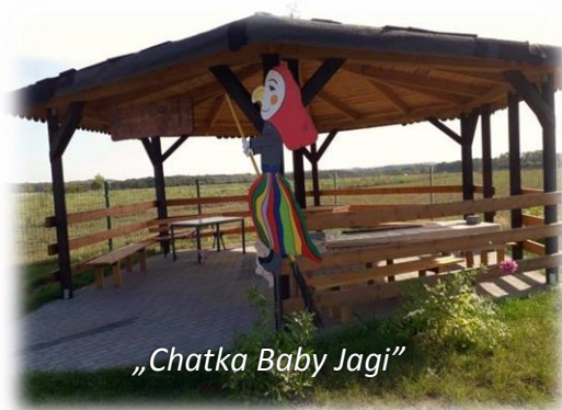
„Chatka Baby Jagi”