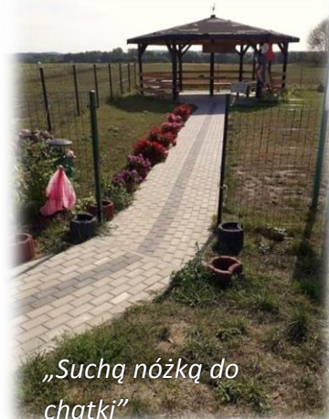
„Suchą nóżką do chatki”