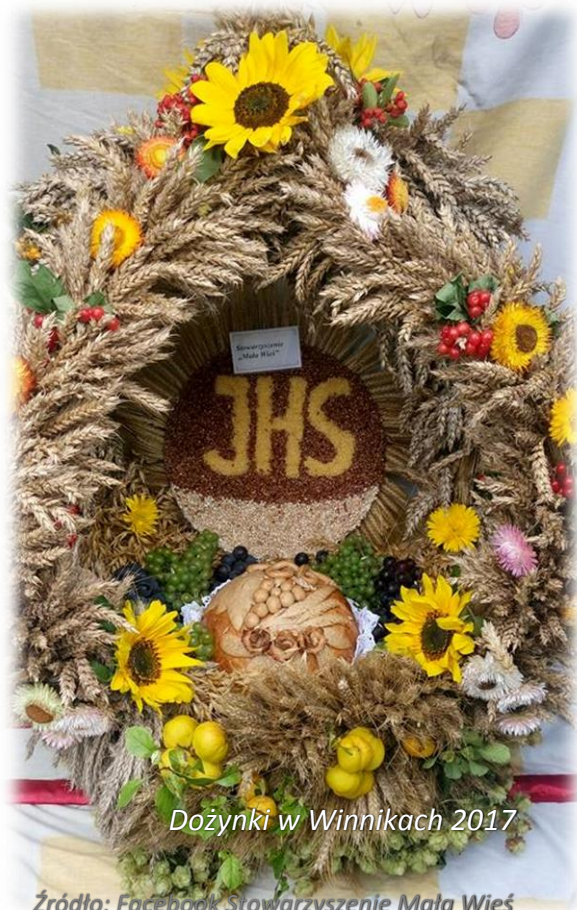
Dożynki w Winnikach 2017