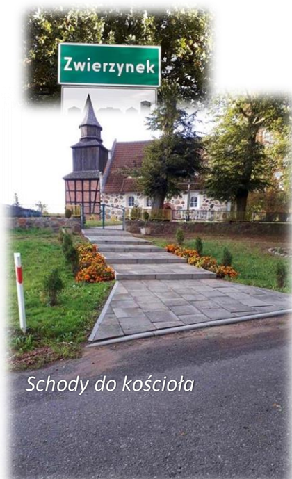
Schody do kościoła

Sołectwo zamieszkuje 167 zameldowanych mieszkańców.