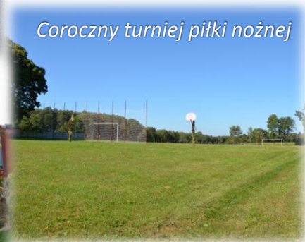
Coroczny turniej piłki nożnej