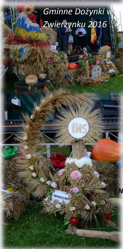
Gminne Dożynki w Zwierzynku 2016