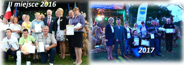
II miejsce 2016