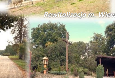
Rewitalizacja m. Wiewiecko