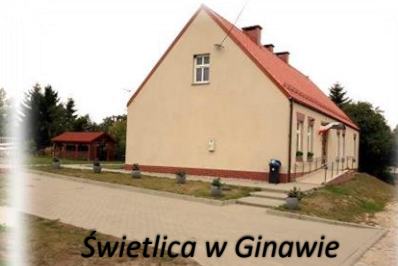
Świetlica w Ginawie