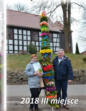
2018 III miejsce