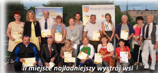
II miejsce najładniejszy wystrój wsi