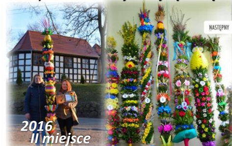
2016 II miejsce

Gminny Konkurs na Najładniejszą Palmę Wielkanocną