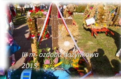
III m. ozdoba dożynkowa 2015