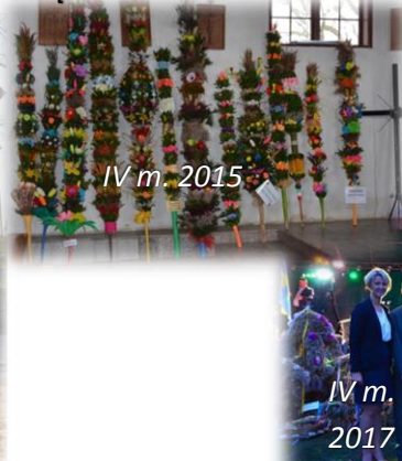
IV m. 2015