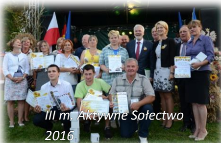
III m. Aktywne Sołectwo 2016

Aktywna i Ekologiczna Wieś Powiatu Łobeskiego 2015