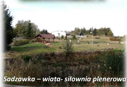
Sadzawka – wiata- siłownia plenerowa