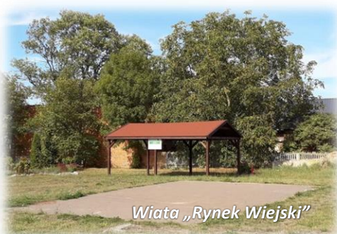
Wiata „Rynek Wiejski”