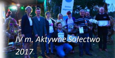
IV m. Aktywne Sołectwo 2017