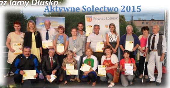
Aktywne Sołectwo 2015