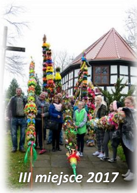
III miejsce 2017