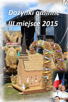
Dożynki gminne III miejsce 2015