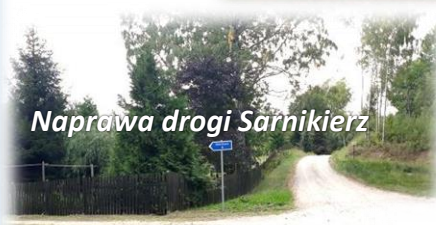
Naprawa drogi Sarnikierz