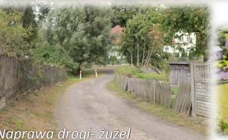
Naprawa drogi- żużel