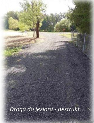
Droga do jeziora - destrukcja