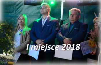
I miejsce 2018