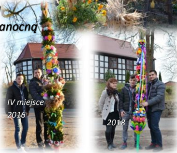
IV miejsce 2016