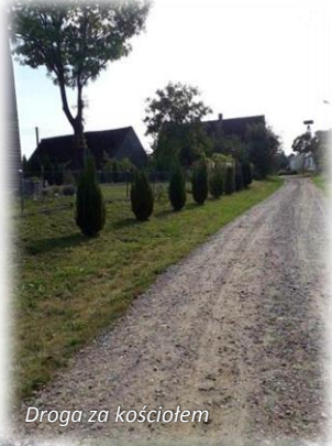
Droga za kościołem