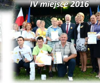
IV miejsce 2016