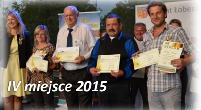
IV miejsce 2015