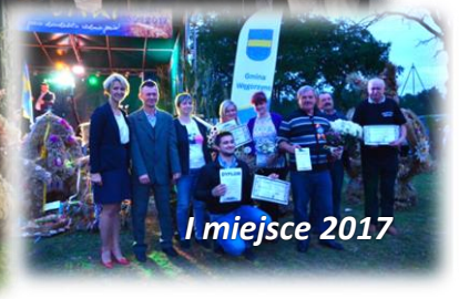
I miejsce 2017