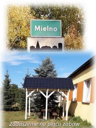
Zadaszenie na placu zabaw

Sołectwo zamieszkuje 145 zameldowanych mieszkańców.