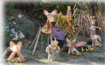
Wystrój dożynkowy wsi 2018