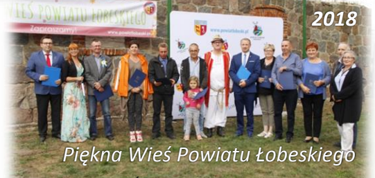
Piękna Wieś Powiatu Łobeskiego