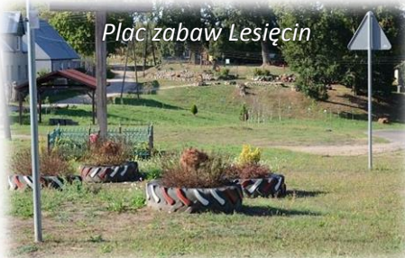
Plac zabaw Lesiecin

Sołectwo zamieszkuje 352 zameldowanych mieszkańców.