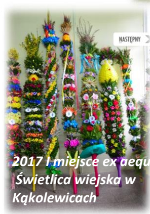
2017 I miejsce ex aequo Świetlica wiejska w Kąkolewicach