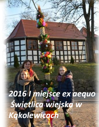
2016 I miejsce ex aequo Świetlica wiejska w Kąkolewicach