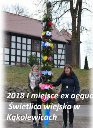
2018 I miejsce ex aequo Świetlica wiejska w Kąkolewicach