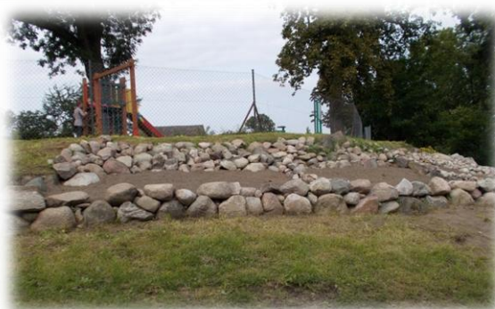
Sołtys Sołectwa Lesięcin Zbigniew Białek