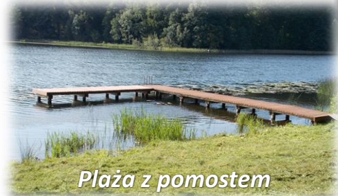
Plaża z pomostem