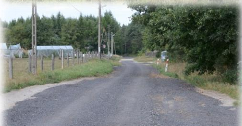
Naprawiona droga - destrukta