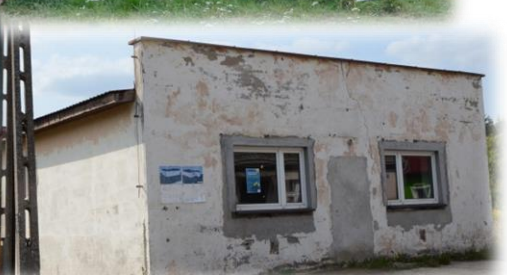
Projekt świetlicy wiejskiej – po sklepie